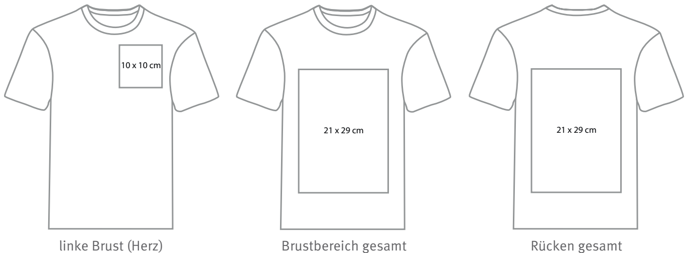
linke Brust (Herz)