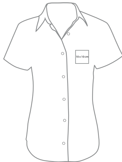
links Brust (Herz)